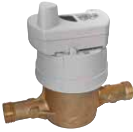
Konut su sayacına takılmış AnyQuest Cyble

AnyQuest, veri oluşturmak ve gelişmiş veriyi toplamak için birlikte çalışarak birden çok bileşenden oluşan bir mobil veri toplama çözümdür. Yüksek performanslı radyo modülleri, sağlam el terminalleri, kullanıcı dostu mobil okuma ve merkezi sistemler arası veri aktarımı ve PC yazılımları içerir.