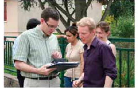
Bölgesel müşteri hizmetleri ekipleri

Müşterilerine kendini adayarak, Itron bölgesel müşteri hizmetleri dünya çapında bir ağ geliştirdi. Bölge, zaman dilimi ve dil ne olursa olsun Itron, anahtar hesap yönetimi hedeflerinize başarıyla hizmet edecek küresel bir hizmet sağlayabilir