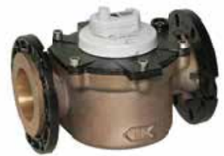
Ticari & Endüstriyel su sayacına takılmış Anyquest Cyble