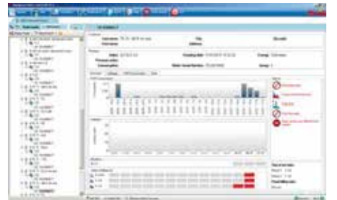
AnyQuest Ana yazılım