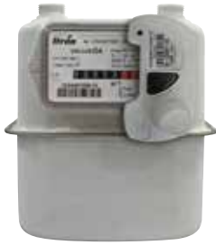
Gaz sayacına takılmış AnyQuest cyble