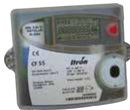
Isı sayacında Anyquest Option Board